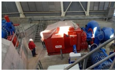
Hidroeléctrica El Pinar Puesta en marcha turbina Francis (Global Hydro)